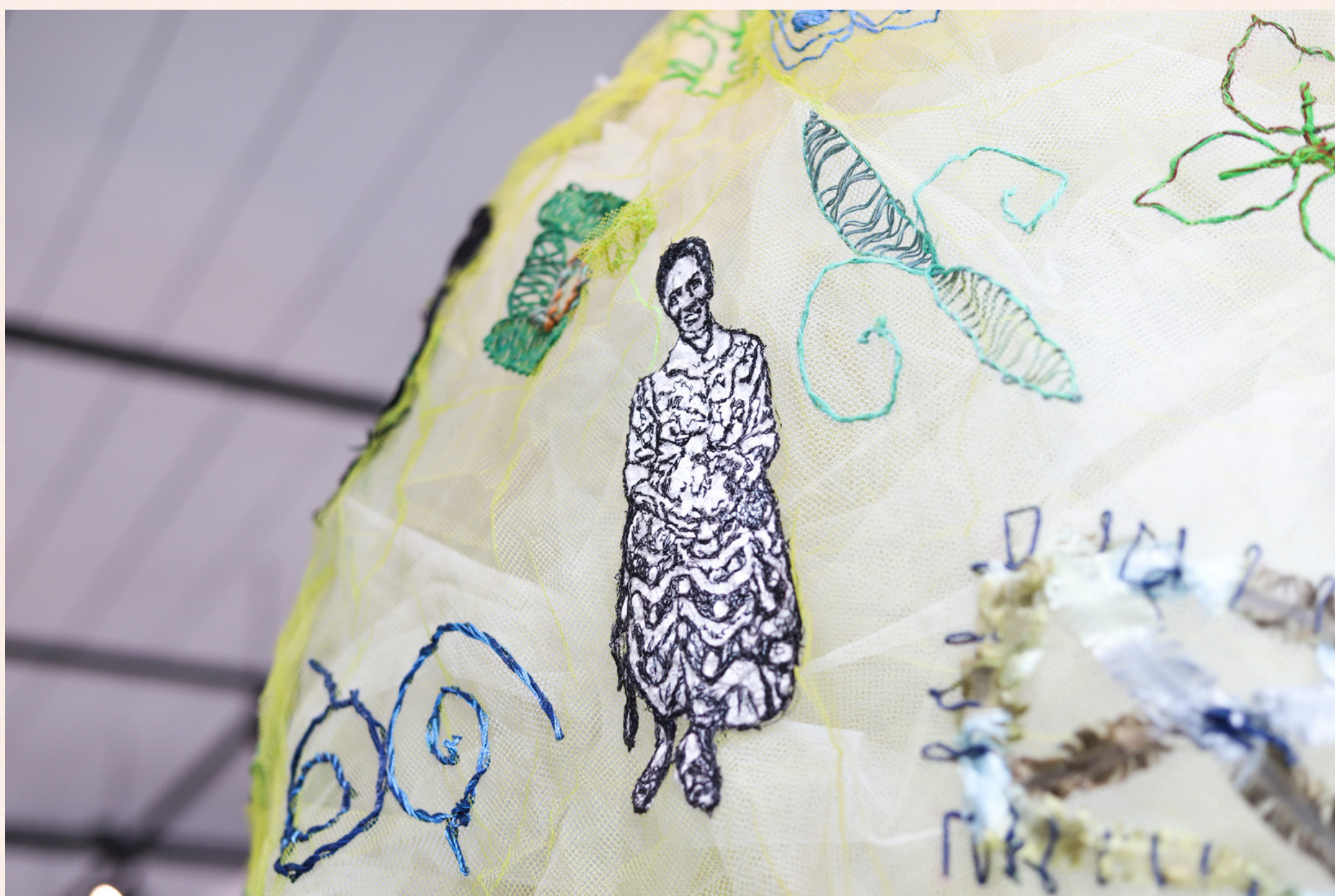
CASULO DE ADINKRAS , 2022 - Detalhes